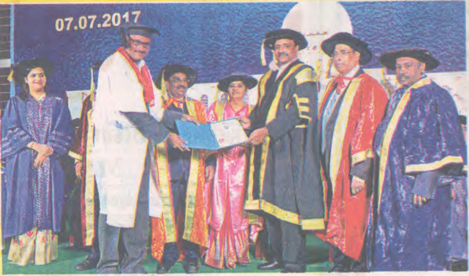
பட்டமளிப்பு விழாவில் கலந்து கொண்டவர்கள்.